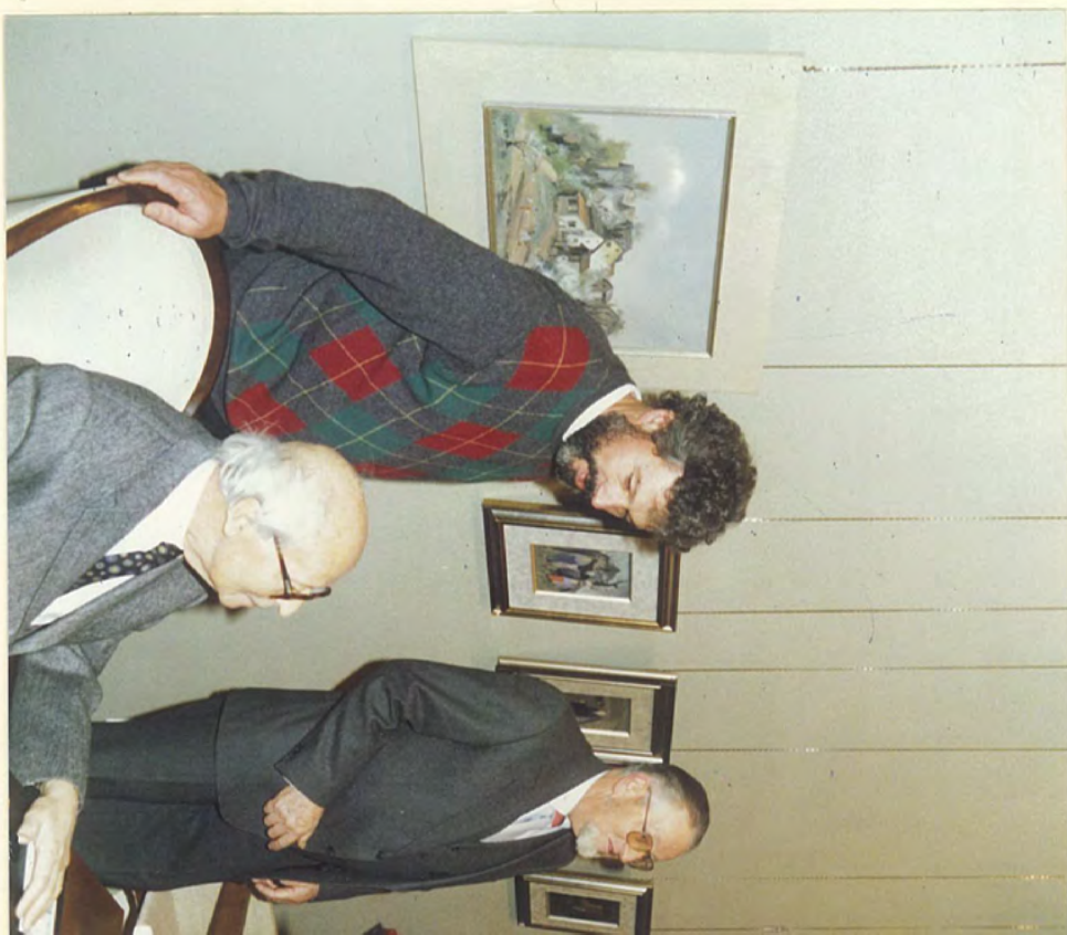
FONDATION Louis Merck 1986 Nan'gny